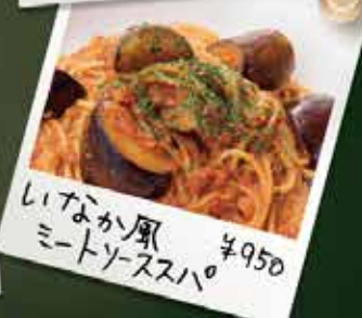
いなか風ミートソーススパ ¥950