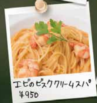
エビのビスククリームスパ ¥950