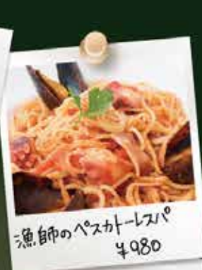
漁師のペスカトーレスパ ¥980