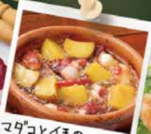
マダコとイモのアヒージョ ¥580