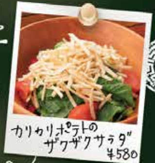
カリカリポテトのザクザクサラダ ¥580