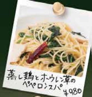
蒸し鶏とホウレン草のペペロンスパ ¥930