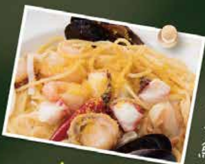
イタリア産カラスミを散らした魚介のペペロンスパ