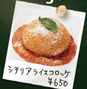
シチリアライスコロッケ ¥650