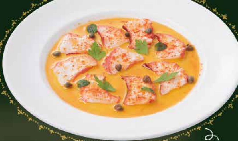
タコのガリシア風